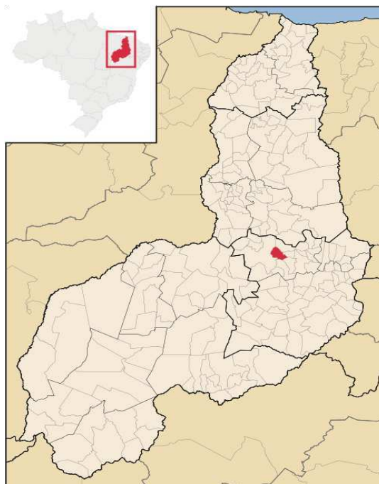
Imagem 1: Localização do município de São João da Varjota – PI

São João da Varjota é um município brasileiro do estado do Piauí. Localiza-se a uma latitude 06°24'47" sul e a uma longitude 41°51'52" oeste, estando a uma altitude de 340 metros. Em 2022, a população era de 4.383 habitantes e a densidade demográfica era de 11,11 habitantes por quilômetro quadrado. Na comparação com outros municípios do estado, ficava nas posições 167 e 102 de 224. Já na comparação com municípios de todo o país, ficava nas posições 4499 e 4201 de 5570. Possui uma área de 387,17 km²., temperaturas que variam em média entre 26°C e 36°C e possui um clima tropical alternadamente úmido e seco.