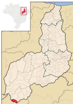
Imagem 1: Localização do município de Cristalândia– PI